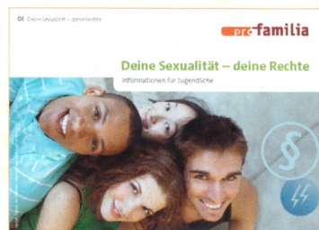
Deine Sexualität – Deine Rechte (Für Jugendliche), auch in Dari und Arabisch (2023)

Bestellungen und Downloads: www.profamilia.de/publikationen