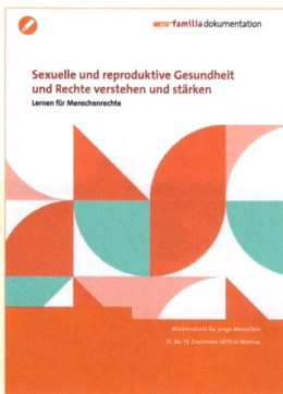
Sexuelle und reproduktive Gesundheit und Rechte verstehen und stärken. Lernen für Menschenrechte. Dokumentation der Winterschool für junge Menschen (2019)