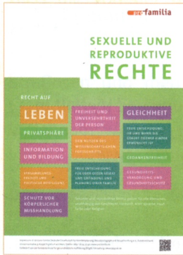
Sexuelle und reproduktive Rechte. Plakat im Format DIN A2 (2023)