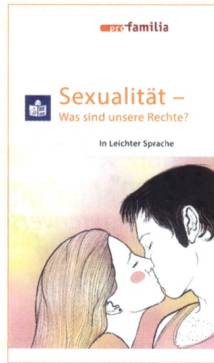
Sexualität – was sind unsere Rechte? In Leichter Sprache (4. Auflage 2023)